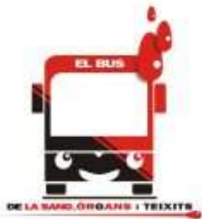
BUS DE LA SANG